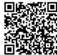
栄町 LINE QRコード