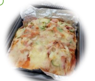
チーズたっぷりピザパン