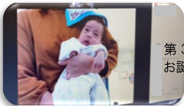
第3子 お誕生おめでとう!