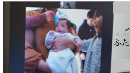
「ぼく、わたしの弟です」