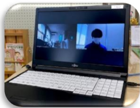
お互いにIDとパスワードを入力して準備(待機)

子育ての相談や悩み、コロナ禍で外出を控えている方、誰かと話がしたいなど、お気軽にご利用ください。