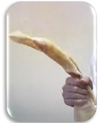
ハンカチろうそく 「ふうっ」