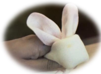
ハンカチパペット うさぎ