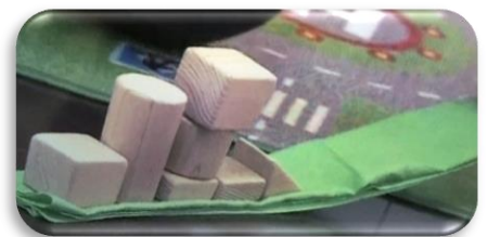
ハンカチに乗せると 積み木列車が動きます