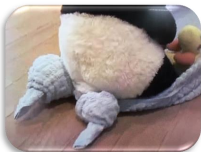
バスタオルトレイン