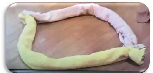
バスタオルライン 長細く巻いて両端をゴムで 止める 中に入ったり、飛んだり♪