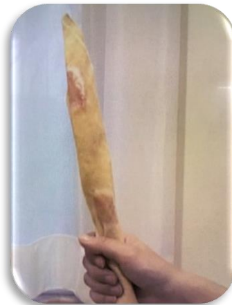
ハンカチろうそく