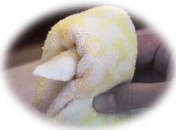
ハンカチパペット 鳥